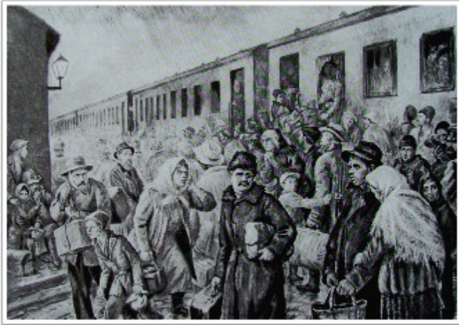
На Краківському вокзалі. Худ. В. Касіян.

та зойків голоси матерів. Саме це зобразив на своїй картині «На Краківському вокзалі» художник В. Касіян.